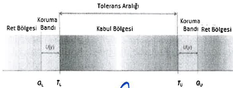
Şekil 2-Alt ve Üst Limite Dayanan Kabul ve Ret Bölgesi (Yanlış Ret)